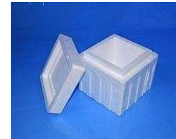
Cubiera cubo provino CLV