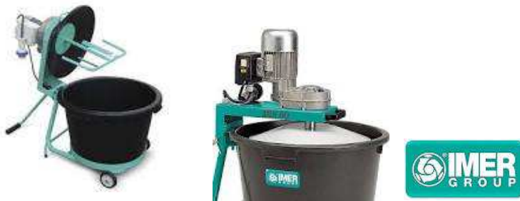
Mescolatore imer mix 60 plus