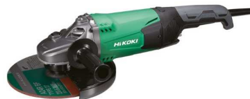
50169 ANGOLARE HITACHI G235W2 2200 W