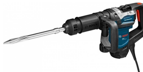
50316 MARTELLO BOSCH GSH 5 KG. 6,2