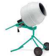
mini beta imer b130 s mf