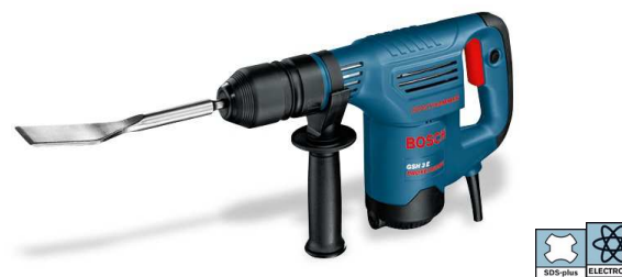
50338 MARTELLO BOSCH GSH 3 E KG. 3,5