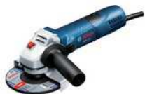
50152 MINI ANGOLARE BOSCH GWS 750 750 W ) SENZA DISCO 50156 MINI ANGOLARE BOSCH GWS 750 750 W ) CON DISCO