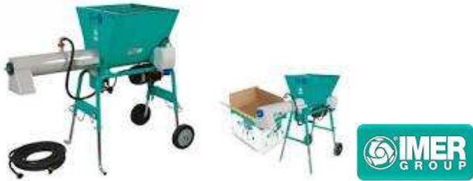
Mescolatore imer spin 15 A