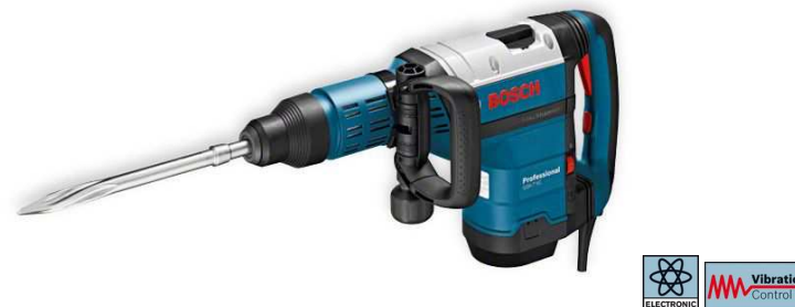
50315 MARTELLO BOSCH GSH 7 VC KG. 8,5