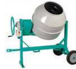
betoniere IMER Modello sintesy